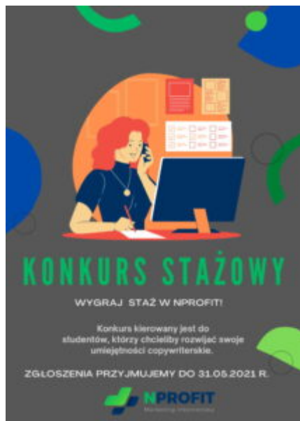
konkurs stażowy na stanowisko copywritera