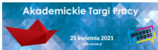
Akademickie Targi Pracy